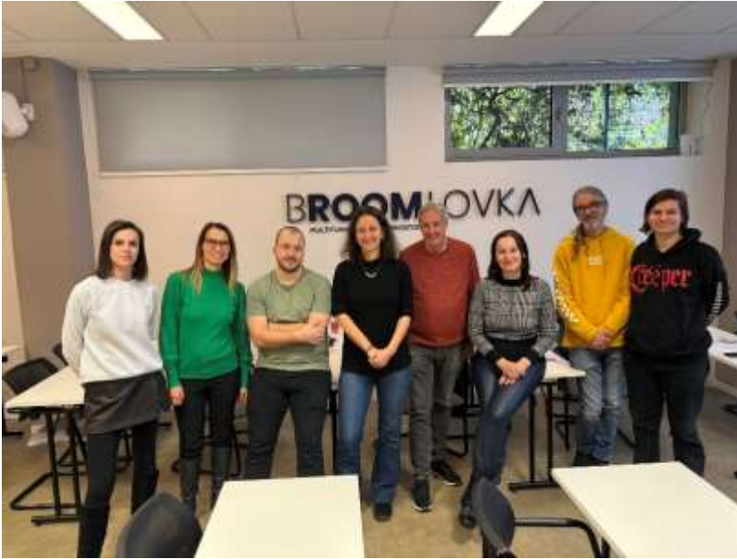
Projektový tým na závěrečné konferenci v Praze, Centrum Broomlovka 28. 11. 2024

Prvním výstupem je Příručka pro profesionály . Umožní jim nahlédnout do využití VR v praxi podporovaného zaměstnávání a v kariérovém poradenství. Najdou v ní užitečné informace, pokud se rozhodnou vytvořit vlastní scénáře a doporučení pro svou praxi.